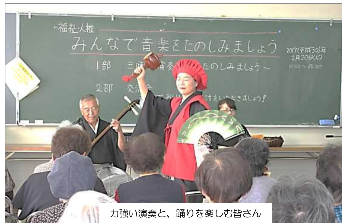
力強い演奏と、踊りを楽しむ皆さん