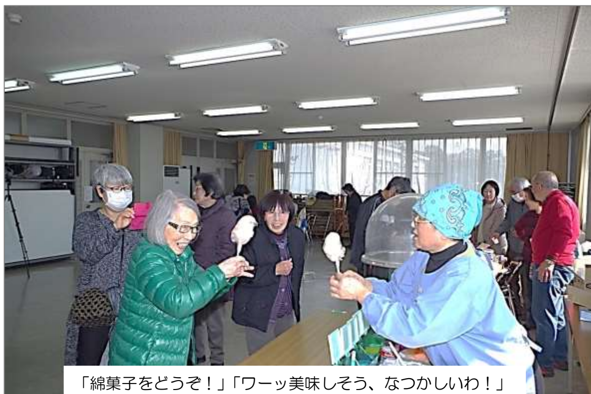
「綿菓子をどうぞ!」「ワーツ美味しそう、なつかしいわ!」