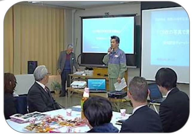
1月25日には発刊記念ティーパーティーを市民センター2階ホールで開催しました