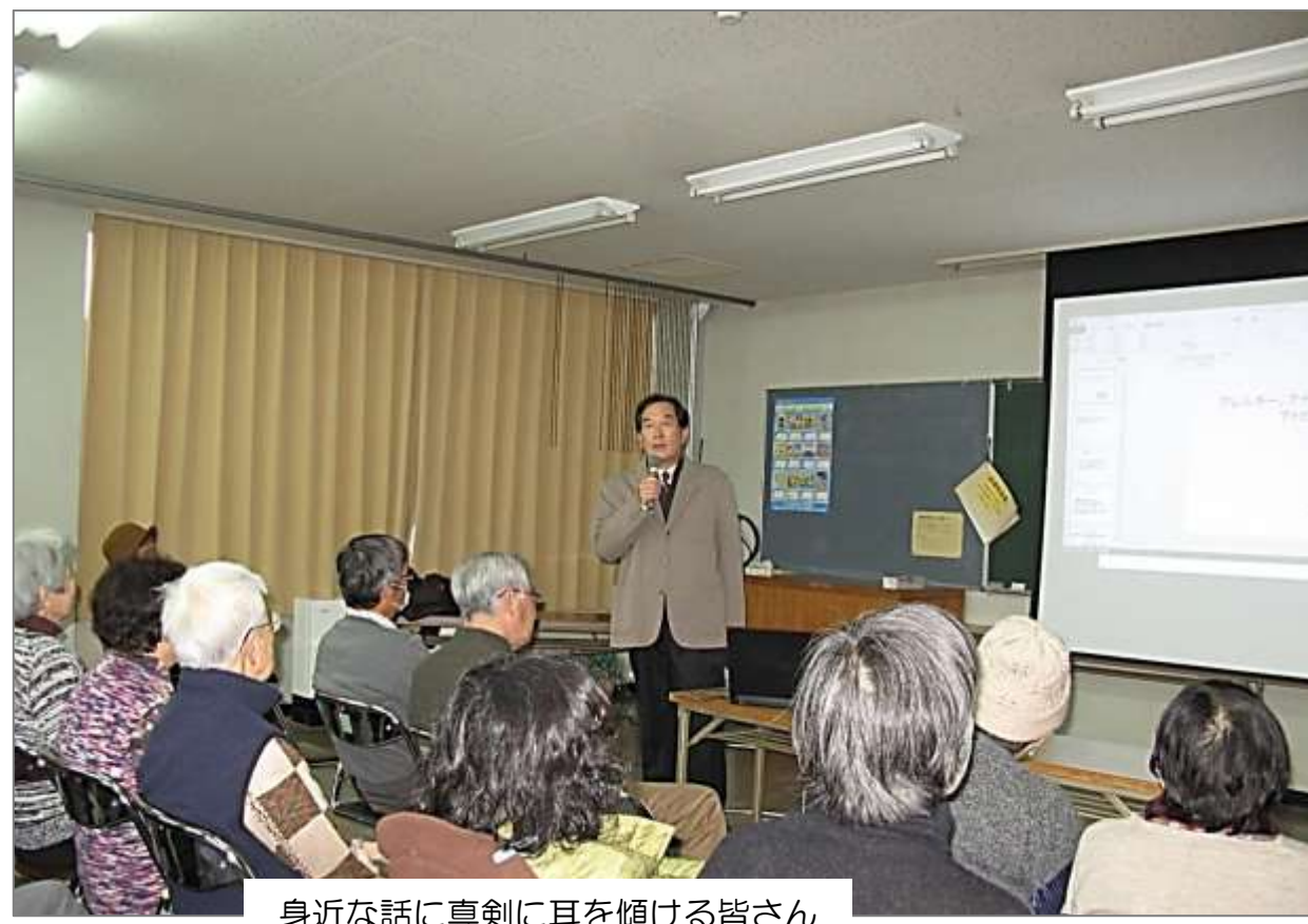
身近な話に真剣に耳を傾ける皆さん