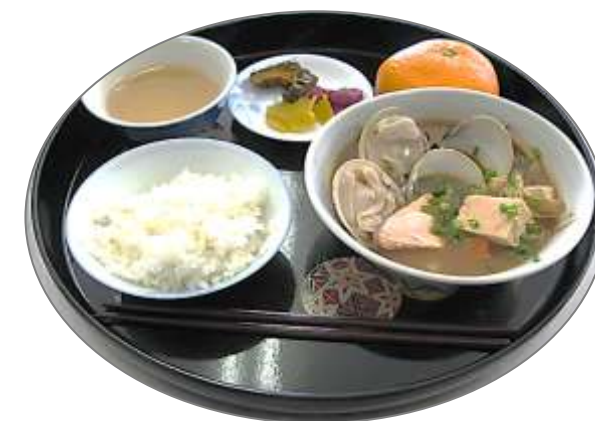
おいしくいただきました