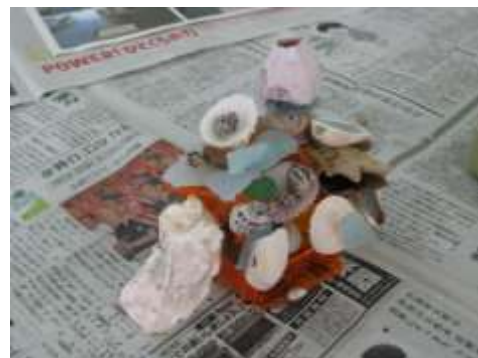
子ども達の素敵な作品