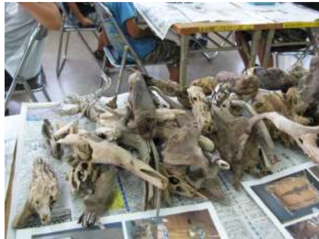
海岸に流れ着いた木々