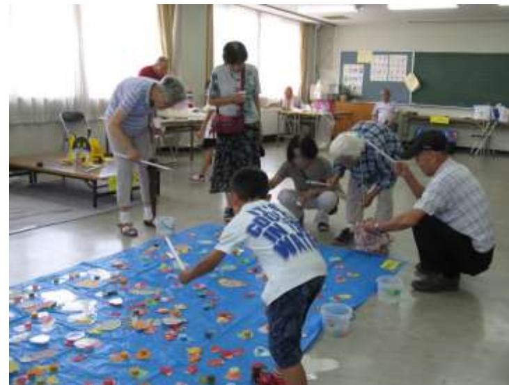
たくさん釣れたよ～