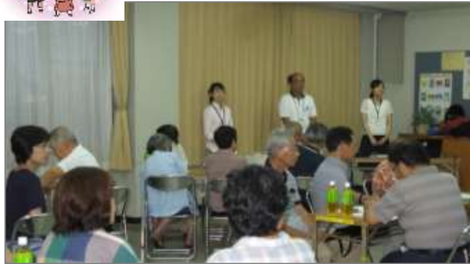
認知症について話し合う皆さん