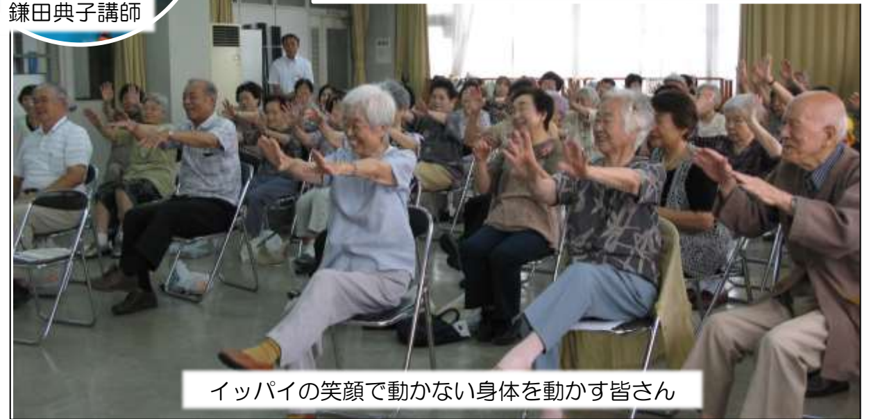
イッパイの笑顔で動かない身体を動かす皆さん