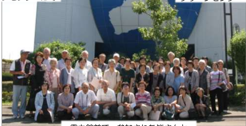
電力館前で、参加された皆さんと