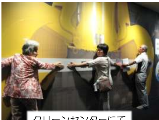
クリーンセンターにて

「博物館」ではプラネタリウムを見学、7月5日の夜空が映し出され、改めて星の美しさを実感しました。生活に密着した環境バスツアー、ロマンもあり有意義な一日でした。