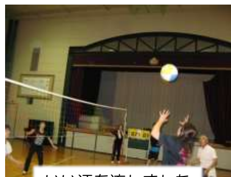
いい汗を流しました

最後にベテラン組の模範試合を見せてもらい、さすが日頃の練習のたまものだと感心をしました。毎週月曜日の6時30分から練習をしています。お気軽にお越しください。