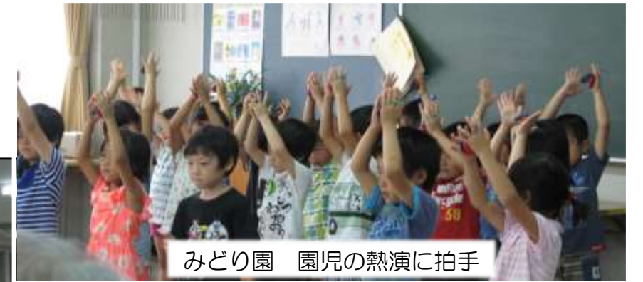
みどり園 園児の熱演に拍手