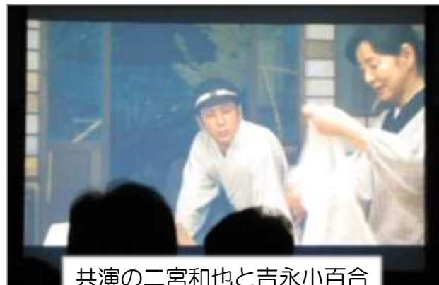
共演の二宮和也と吉永小百合