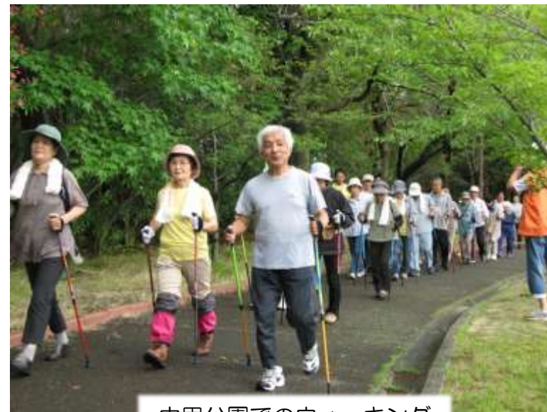
中里公園でのウォーキング