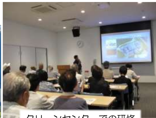
クリーンセンターでの研修