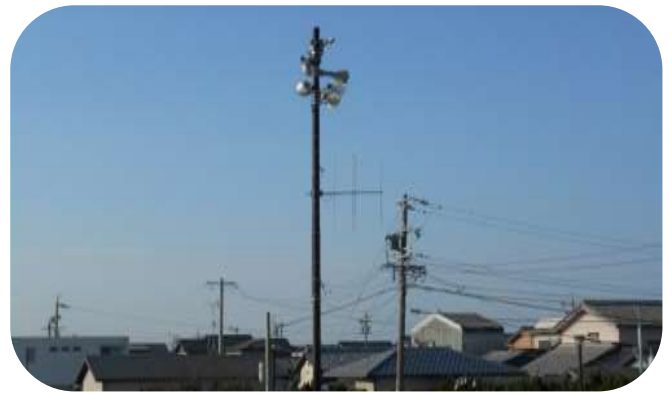
塩浜地区連合自治会 放送設備設置事業実行委員会