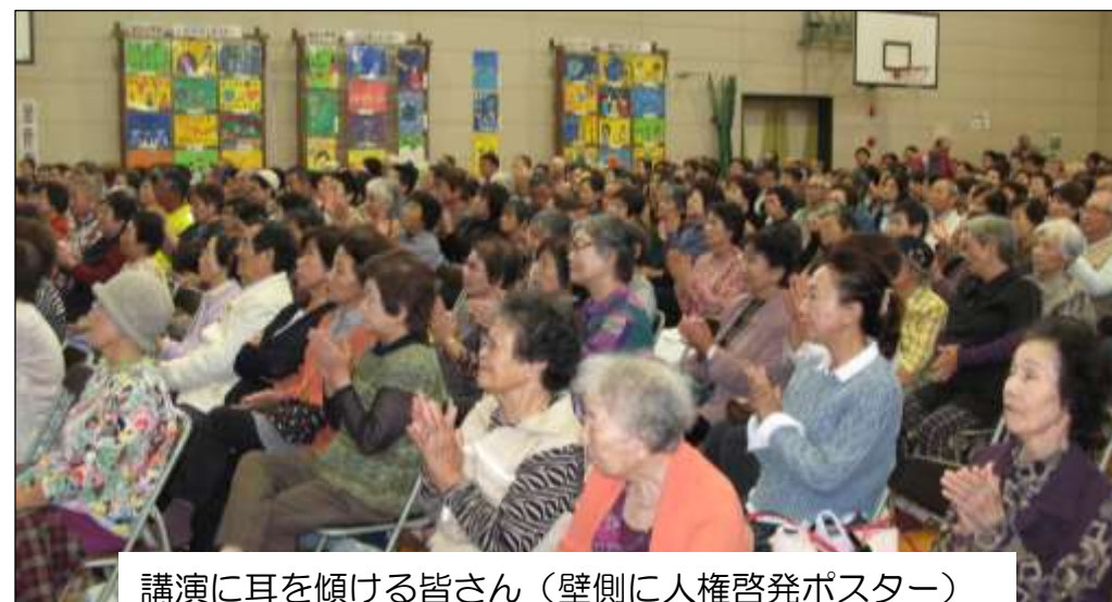
講演に耳を傾ける皆さん(壁側に人権啓発ポスター)