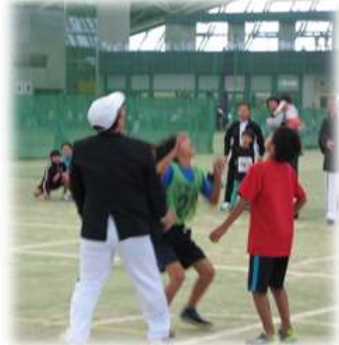
がんばろうドッジボール