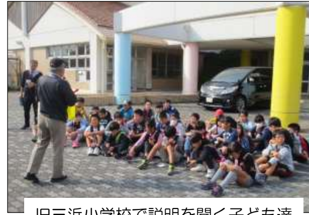
旧三浜小学校で説明を聞く子ども達