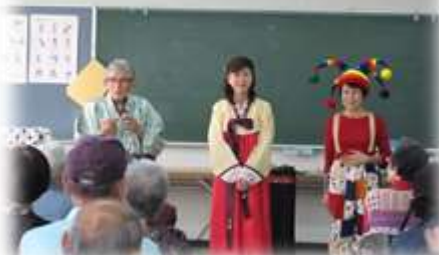
四日市マジック愛好会の方々

ビンゴでは数字を読み上げる度に「リーチ」、「ビンゴ」の声が上がり楽しい時間を過ごしていただきました、細やかな賞品を頂いて11:40頃解散しました。