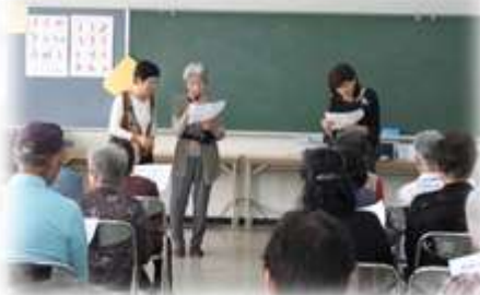
「ボケナイ小唄(?)」の合唱