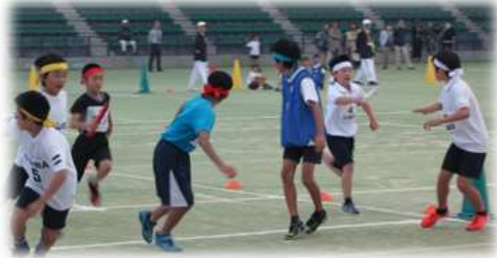
盛り上がる地区別リレー