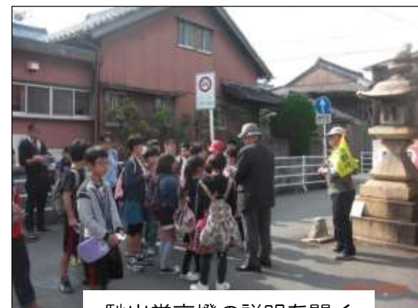
馳出常夜燈の説明を聞く