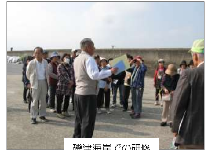
磯津海岸での研修

「まち歩き行程」—地区市民センター(バス)—磯津漁港—まるい水産加工場—磯津海岸—塩崎神社(バス)—旧三浜小跡地—海山道神社—近鉄斜め踏切—馳出常夜燈—馳出地藏堂—馳出町倶楽部(休憩)—金剛寺—浄福寺—法柳寺—地区市民センター