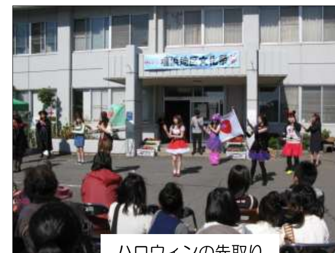
ハロウィンの先取り