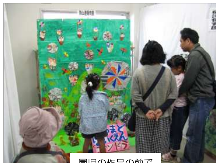
園児の作品の前で