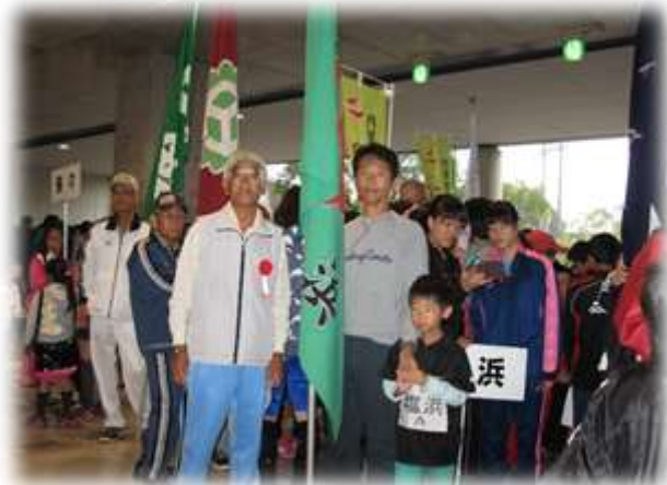
気合を入れて入場行進

それでも怪我も無くスポーツの秋を十分楽しんでいただいたように思います。来年は入賞を目指して頑張りましょう、お疲れさまでした。