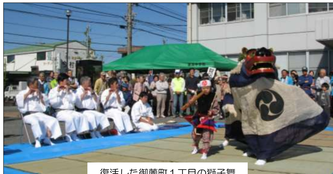
復活した御菌町1丁目の獅子舞