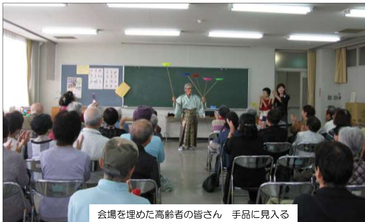
会場を埋めた高齢者の皆さん 手品に見入る