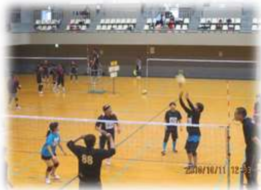
熱戦のソフトバレー