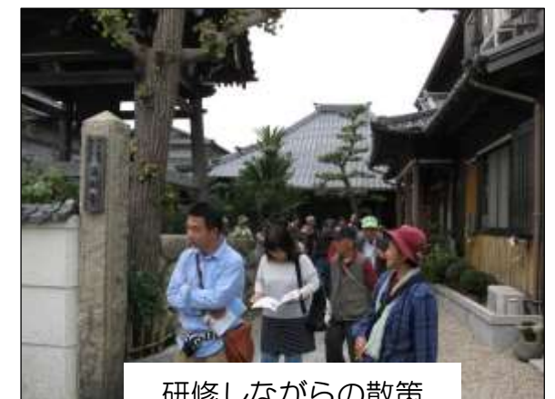
研修しながらの散策