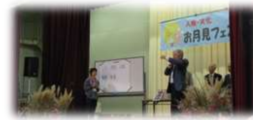
チケットの半券番号を読み上げる 交流会の舞台