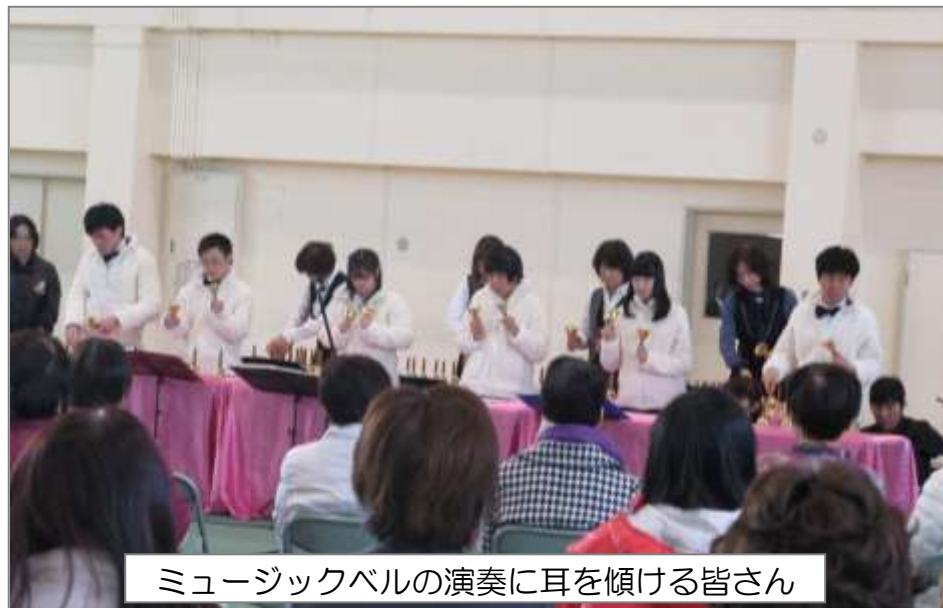
ミュージックベルの演奏に耳を傾ける皆さん