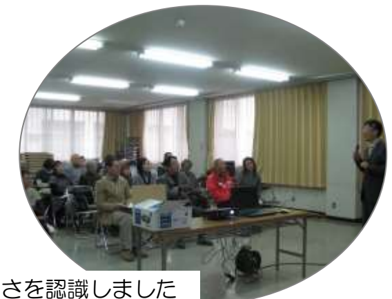
口腔ケアの大切さを認識しました